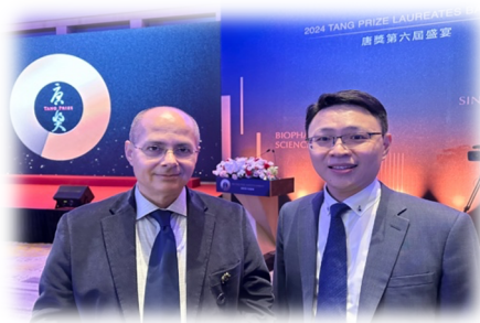
許景翔系友與2025年唐獎與諾貝爾化學獎得主Prof. Omar合影